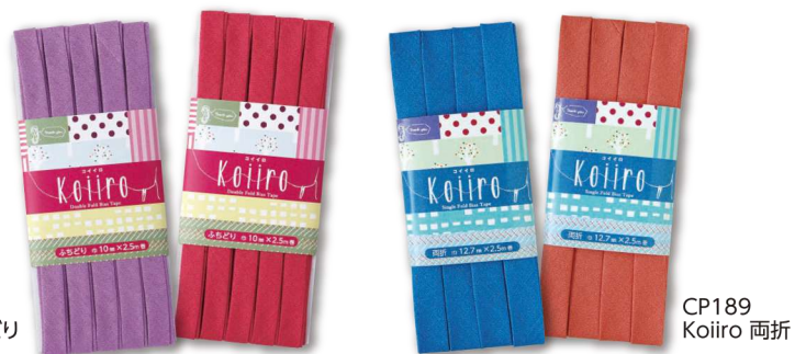
CP188 Koiiro ふちどり