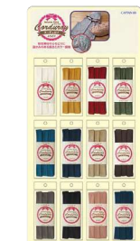
■ボードサイズ: タテ65cm×ヨコ31cm