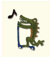
3 ワニのキックボード