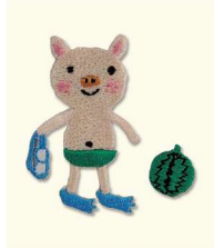
5 ぶたのスイカ割り