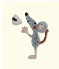
10 ねずみとおにぎり