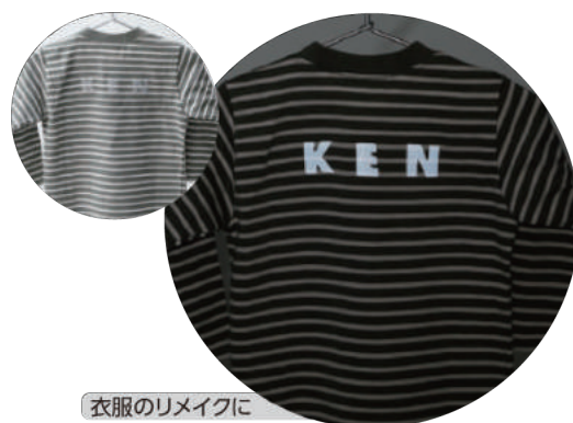
衣服のリメイクに